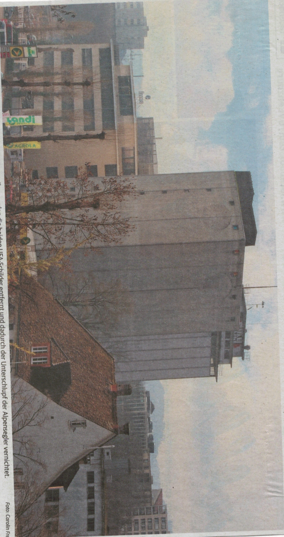
Brut- und Schlafplätze sind weg: Bei den markanten Futtersilos wurden die beiden UFA-Schilder entfernt und dadurch der Unterschlupf der Alpensegler vernichtet.